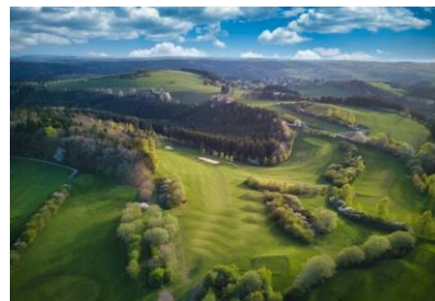
Luftbild von Bahn 13, 14, 15 und 16