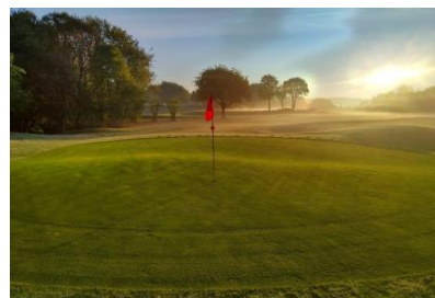
Sonnenaufgang Grün Bahn 7