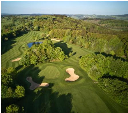
Grün Bahn 5 mit Blick auf Bahn 2 und 7

Unser umweltverträglich ausgerichteter Par 71 Platz in etwa 500 m Höhe, mit altem Baumbestand, zahlreichen neu angepflanzten Bäumen und Sträuchern bietet wertvollen Natur- und Lebensraum für Tiere und Pflanzen. Hier finden Spieler aller Spielstärken "inmitten der Natur" hervorragende Spielbedingungen. Breite Fairways, top gepflegte Grüns, strategische Bunker und einige Wasserhindernisse runden das Gesamtbild einer traumhaften 18-Loch Anlage ab.