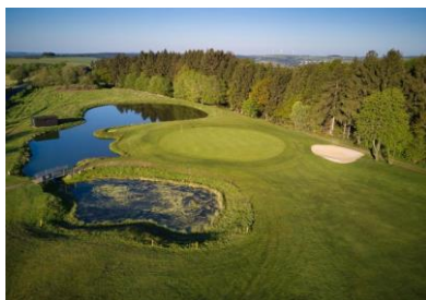
Grün Bahn 9 auf einer Halbinsel

Egal, ob Anfänger oder passionierter Spieler, hier können Sie in ländlicher Natur die sportliche Herausforderung genießen. Ein schönes Clubhaus mit herrlicher Terrasse lädt nach der Runde zum Verweilen ein.